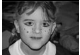
Une petite écolière