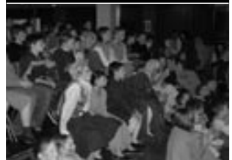
Les enfants dans la salle de bal devant la projection DVD.