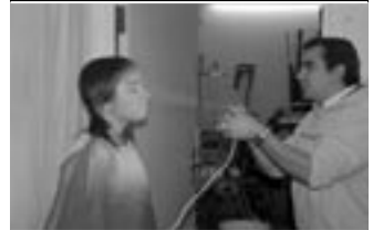
Séance fond de teint