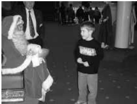
C'était super, merci pour les bonbons...

M ais le spectacle de La Paternelle, c'est aussi tout le travail qui se fait en coulisses. Abandonnant la scène et ses projecteurs, je suis donc passé de l'autre côté du décor. Et là, j'ai découvert un autre monde. Ainsi, j'ai rencontré des dames et des messieurs qui, dans la pénombre de l'arrière-scène et en plein courants d'air, gardaient, stoïques, les portes des coulisses à longueur de soirées. J'ai croisé un Père Noël suant et soufflant après avoir résisté à l'assaut de plusieurs centaines de mains d'enfants, quémandant des sucreries. J'ai